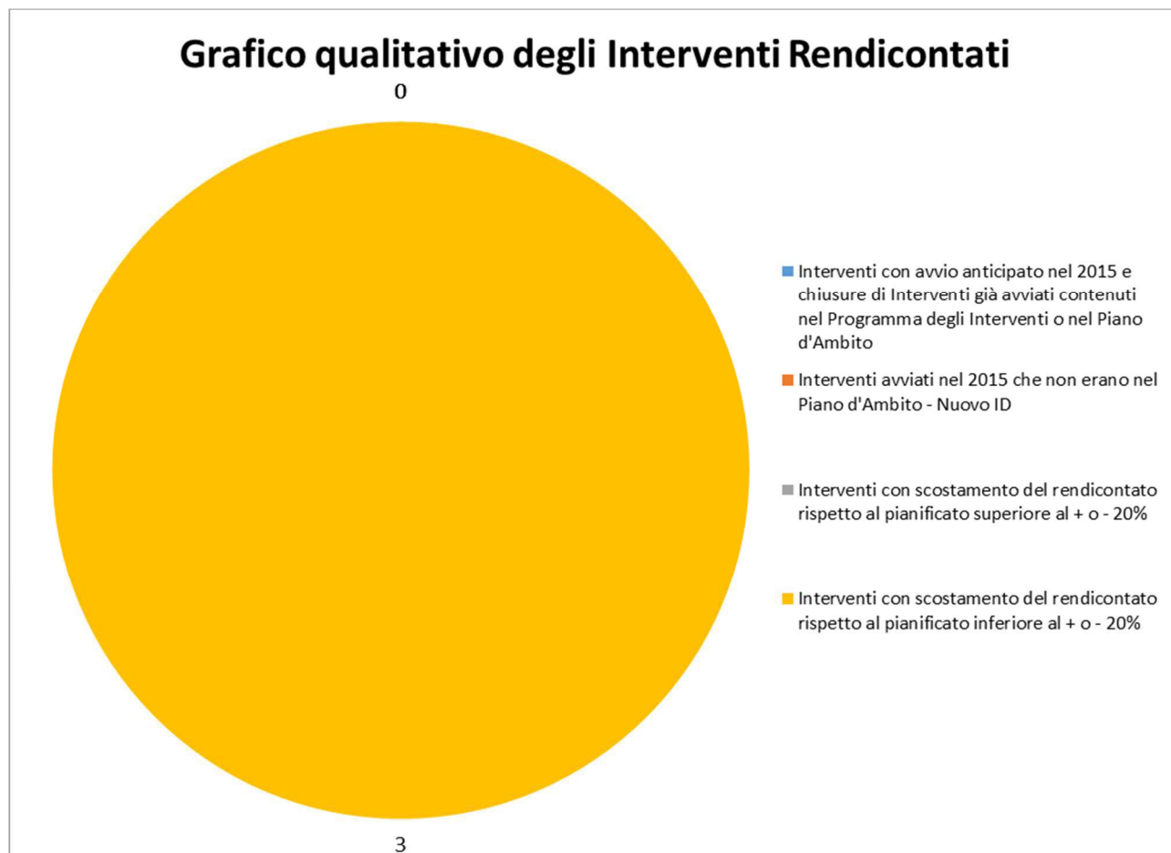
Fig.2 – Illustrazione qualitativa degli interventi avviati dal gestore e rendicontati

Dalla tabella risulta che il gestore, ha avviato nel 2015 tutti gli interventi che erano stati programmati (per l'elenco si veda Allegato 1), si può notare come rispetto agli interventi programmati che il gestore ha rendicontato di questi nessuno ha avuto uno scostamento rispetto alle previsioni di spesa superiore al 20% in più o in meno.