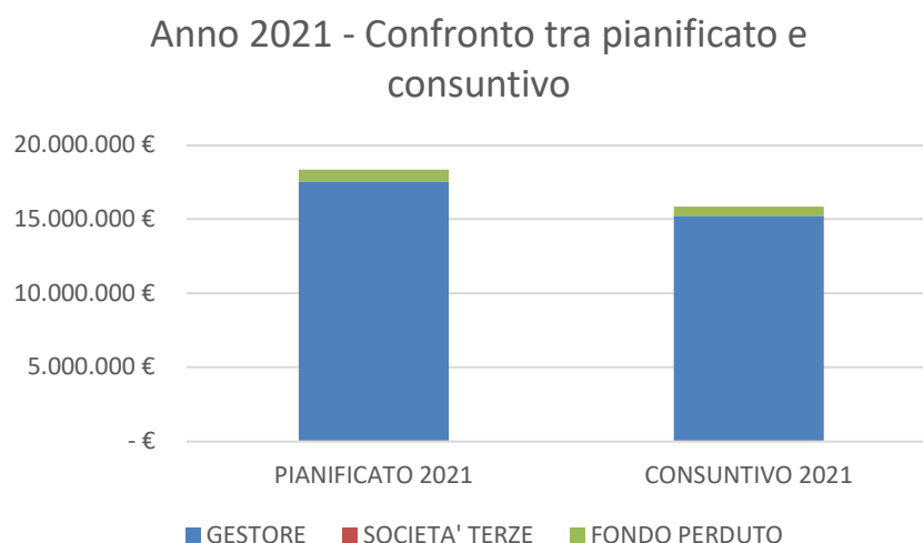
Fig. 1 – Istogramma di confronto tra quanto pianificato e quanto rendicontato nel 2021

Dalla tabella sopra riportata si nota come il gestore HERA abbia effettuato nel corso del 2021 investimenti inferiori rispetto al pianificato per circa il 14%.