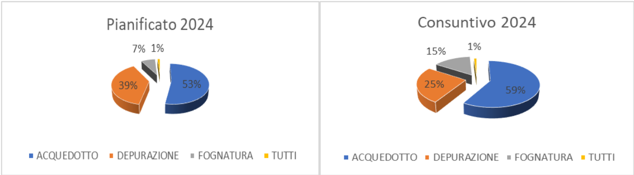
FIG.2 –Suddivisione investimenti 2023 per servizio

Gli investimenti realizzati nell'annualità 2024 sono stati suddivisi per categorie e rappresentati graficamente come segue: